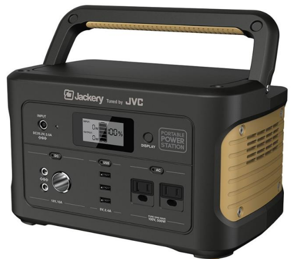
ポタブル電源外形