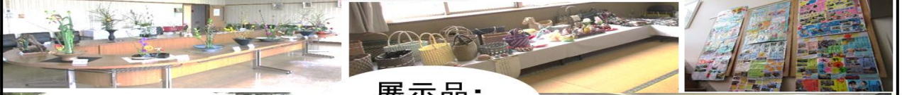
展示品・ 会場風景