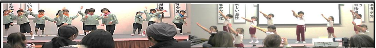
第三部 芸能発表等