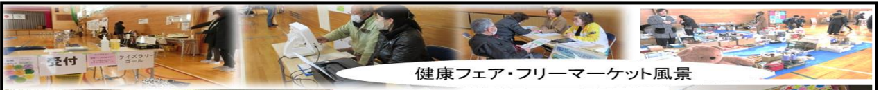
健康フェア・フリーマーケット風景