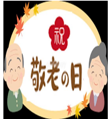
【記事提供:社会福祉協議会笠郷支部】